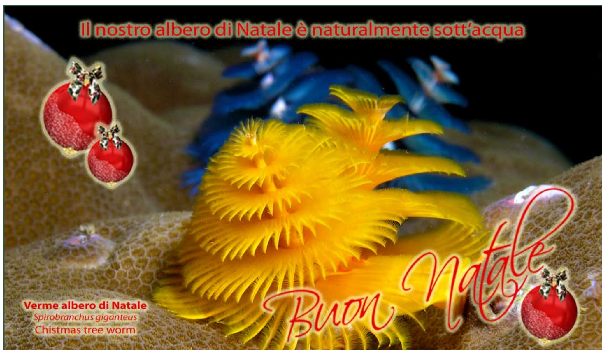
Verme albero di Natale Spirobranchus giganteus Christmas tree worm

Il nostro albero di Natale è naturalmente sott'acqua