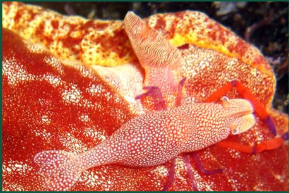
Hexabranhus sanguineus con Gamberetto