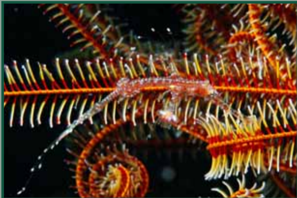
Solenostomus paradoxus (juvenile)